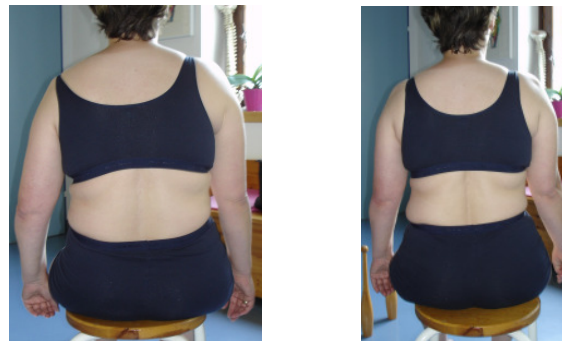
Patientin, 48 Jahre alt, Status nach rechtshirnigen Schlaganfall im Jahr 2001, von mir nach Bobath im Juli 2007 im Rahmen einer Projektarbeit behandelt. Die Bilder entstanden vor der Behandlung und danach. Sichtbar ist eine deutliche Tonussteigerung im Rumpf, eine Verbesserung der Aufrichtung und der Symmetrie sowie eine Reduktion der Spastik im linken Arm.